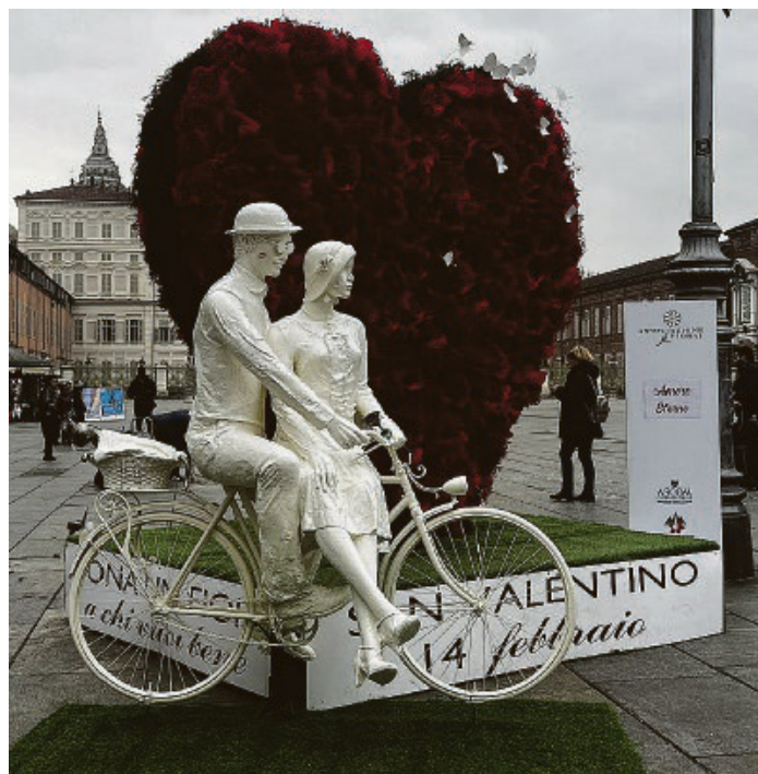
L'opera esposta in piazza Castello

L'INIZIATIVA Curiosità e tante foto ricordo per l'installazione creata in piazza Castello